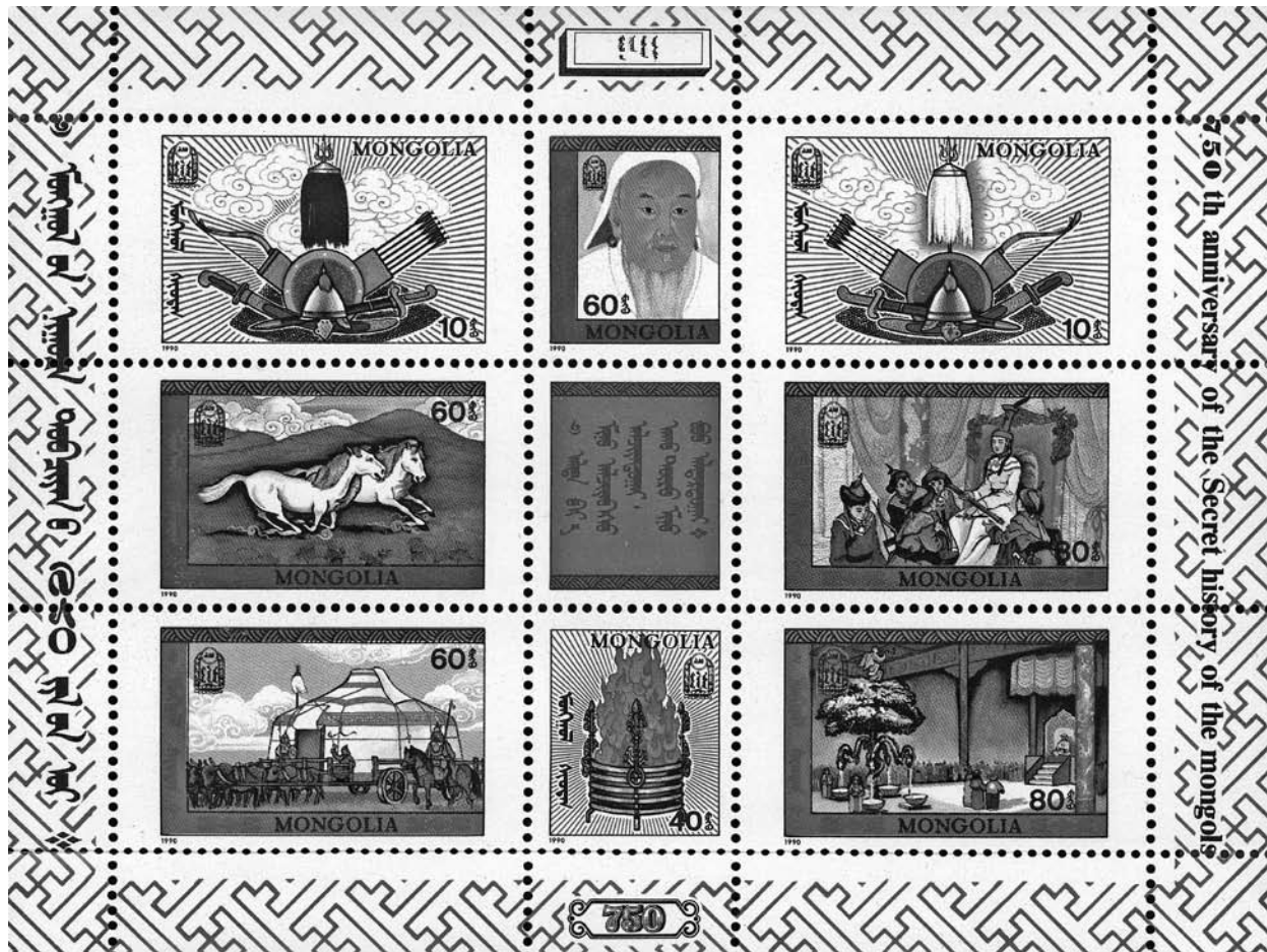
גיליון בולים מונגוליים לציון יובל ה־750 לחיבור ההיסטוריה הסודית, שנת 1990

היה הכיבוש המונגולי הכיבוש הזר היחיד בהיסטוריה. הגורם הדתי מילא גם כאן תפקיד חשוב: הכרוניקות הרוסיות הנוצריות-האורתודוקסיות מציגות את צ'ינגיס ויורשיו כפרשי השטן, שבאו לפגוע בנוצרים האורתודוקסים. התאסלמות המונגולים באורדת הזהב בראשית המאה הארבע-עשרה, שיצרה מצב שבו במשך קרוב למאתיים שנה היו הנוצרים כפופים למוסלמים השנואים, העמידה את הרוסים, ובייחוד את הכנסייה הרוסית, במצב מביש במיוחד. כדי להימנע מן ההתמודדות עם ההשלכות המשפילות של פרק זה, בחרו הכרוניקות הרוסיות בנות התקופה ב"אידאולוגיה של השקט" (אם להשתמש במונח שהציע ההיסטוריון צ'רלס הלפרין [Halperin]), כלומר, התעלמות מהכיבוש המונגולי-הטטרי והצגת השלטון בן שלוש-מאות שנה כסדרה של פלישות טטריות עקובות מדם. תהליך זה הקל על הדה-לגיטימציה של השלטון המונגולי, ולאחר נפילת אורדת הזהב בראשית המאה השש-עשרה הוא הונצח כ"עול הטטרי" (Tatar yoke). למרות החוב העצום של רוסיה למונגולים, או אולי בגללו (שהרי גבולותיה הפוליטיים ורבים ממוסדותיה נבנו על בסיס תקדימים שנקבעו על-ידי אורדת הזהב), ניסתה רוסיה