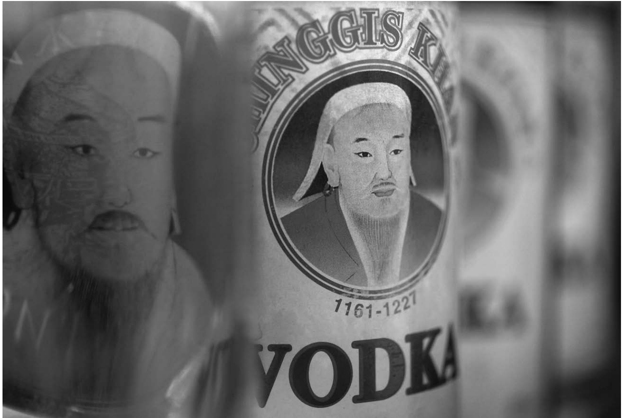
וודקה "צ'ינגיס ח'אן" הנמכרת בחבל האוטונומי של מונגוליה הפנימית בסין

של צ'ינגיס, אימצו את תימור לנג, כובש אכזר אף יותר מצ'ינגיס אך מקומי – ומוסלמי – כאבי האומה. תימור (שצאצאיו, למרבה האירוניה, גורשו מאוזבקיסטאן על-ידי האוזבקים) הפך שם למדינאי דגול, רודף שלום וצדק, וחובו ההיסטורי לתפישות צ'ינגיסיות נשכח לחלוטין. צ'ינגיס, לעומת זאת, מוצג שם ככובש אכזר, שהרס את סמרקנד שנבנתה מחדש על-ידי תימור אחריו; והמונגולים הם רק אחד האויבים שאותם ניצח תימור (לצד העות'מאנים, ההודים והרוסים).